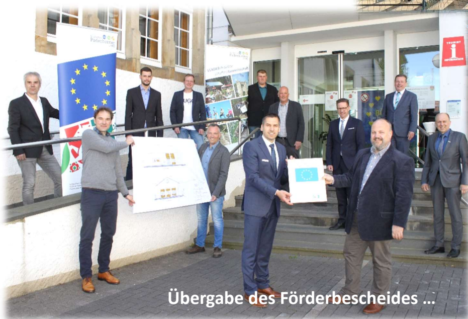
Übergabe des Förderbescheides ...