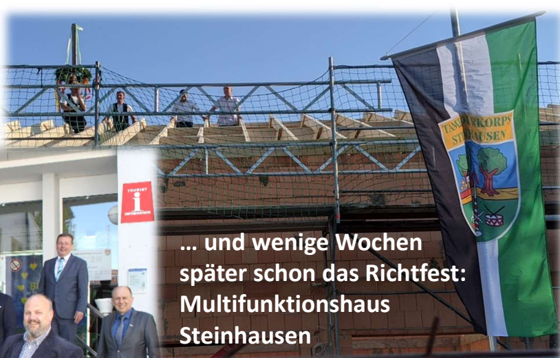
... und wenige Wochen später schon das Richtfest: Multifunktionshaus Steinhausen