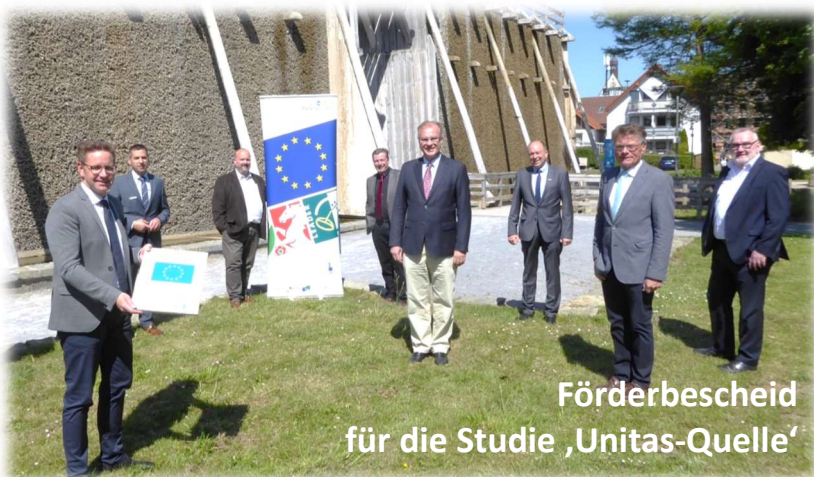
Förderbescheid für die Studie 'Unitas-Quelle'

Für zwei weitere Projekte (Dorfgemeinschaftshaus Eickhoff und Multifunktionspavillon Bad Wünnenberg) wird der Förderbescheid noch in diesem Jahr erwartet. Im Ergebnis wurden in diesem Jahr Fördermittel in Höhe von einer ca. 1 Million € durch das Regionalmanagement beantragt und durch die Bezirksregierung bewilligt!