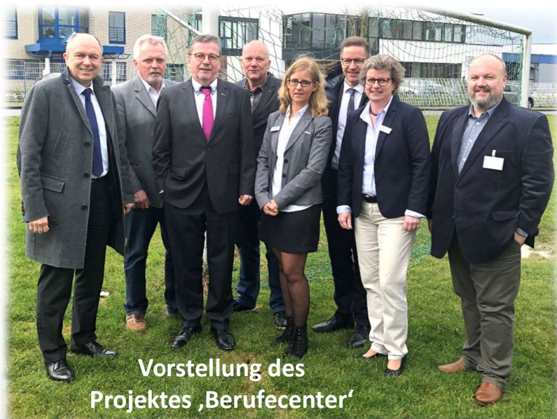
Vorstellung des Projektes 'Berufecenter'

Übergabe des Förderbescheids für das Projekt 'Dorfmitte Asseln'