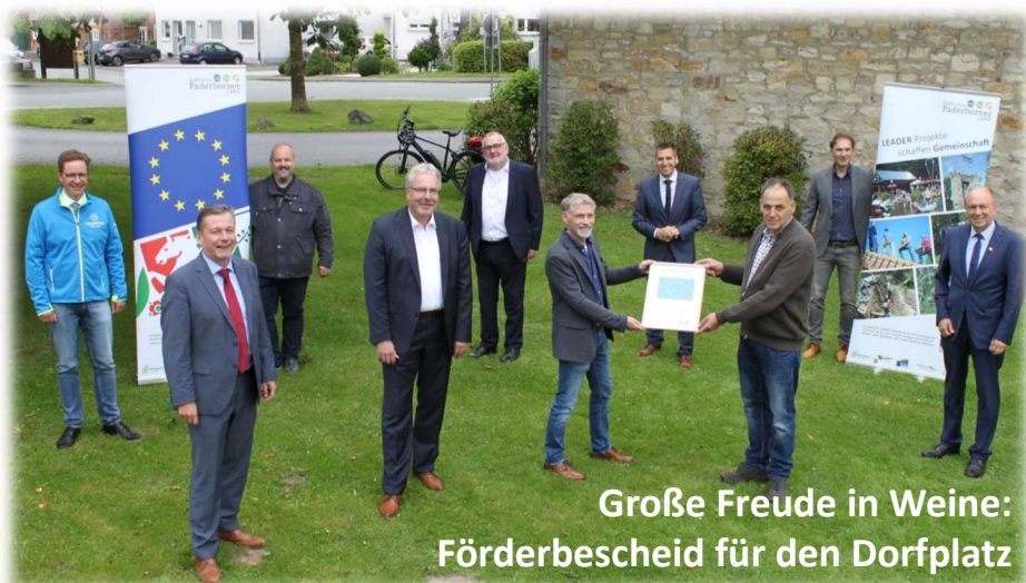
Große Freude in Weine: Förderbescheid für den Dorfplatz

Akteure und Bürger haben die LEADER-Projekte im Blick!