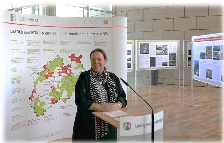
>> Bild: Ursula Heinen-Esser eröffnet die LEADER-Ausstellung im Landtag

Im November fand die Ausstellung „LEADER und VITAL.NRW – Für starke ländliche Räume in Nordrhein-Westfalen“ im NRW Landtag statt. Ziel dabei ist u.a. beispielhafte LEADER und VITAL.NRW Projekte zu präsentieren, die zeigen, mit welcher Tatkraft und Innovationsfreude sich die Menschen vor Ort für starke und lebenswerte ländliche Regionen einsetzen. Wir als LEADER-Region Südliches Paderborner Land waren mit 3 Leuchtturm-Projekten in der begleitenden Ausstellung vertreten! Die Ausstellung fand statt auf Einladung von Landtagspräsident André Kuper und Umweltministerin Ursula Heinen-Esser statt, die sie auch im Beisein von vielen Regionsvertretern und Landtagsabgeordneten eröffnete.